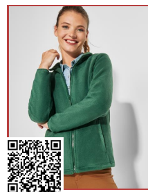
ARTIC WOMAN CQ6413