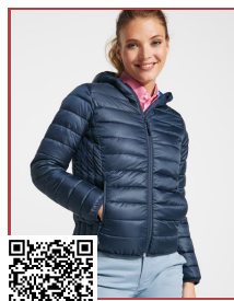
NORWAY WOMAN RA5091