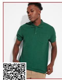
CENTAURO PREMIUM PO6607