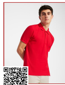
PEGASO PREMIUM PO6609