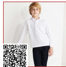
CARPE CHILD PO5008