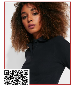
LLA WOMAN L/S PO6635