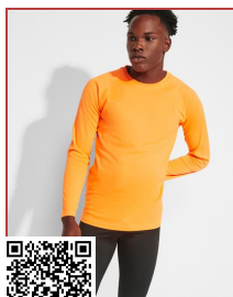
MONTECARLO L/S CA0415